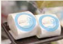
塩かるかん 1個172円(税込)

店内には、他にもお菓子がいっぱい！歓送迎やちょっとした土産など、幅広い用途のプレゼントにもぴったり！