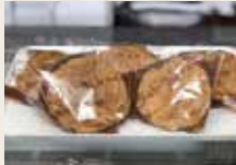
米粉シュークリーム 1個172円(税込)

「のせ菓楽」と言ったら、何ととっても100%グルテンフリーのお菓子☆なので、小麦粉アレルギーの方も安心して食べていただけます。数あるお菓子の中でもイチオシは、「塩かるかん」と「シュークリーム」です。甘すぎず何個でも食べれます。