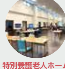
特別養護老人ホーム つきみ園